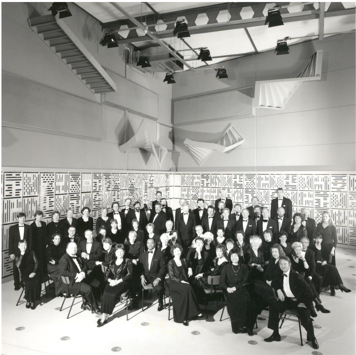
Groot Omroepkoor 1998 - MCO studio 4

In 1998 werd deze groepsfoto gemaakt van het Groot Omroepkoor in studio 4: